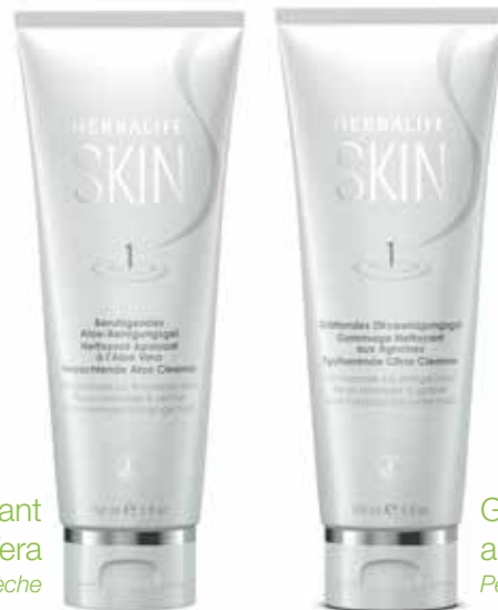
Nettoyant Apaisant à l'Aloe Vera Peau normale à sèche

48% des hommes ne se nettoient pas le visage, alors que ce geste peut nettement améliorer l'aspect de votre peau et montrer que vous prenez soin de vous. Herbalife SKIN propose une variété de lotions nettoyantes adaptées à votre type de peau et qui n'assèchent pas la peau.